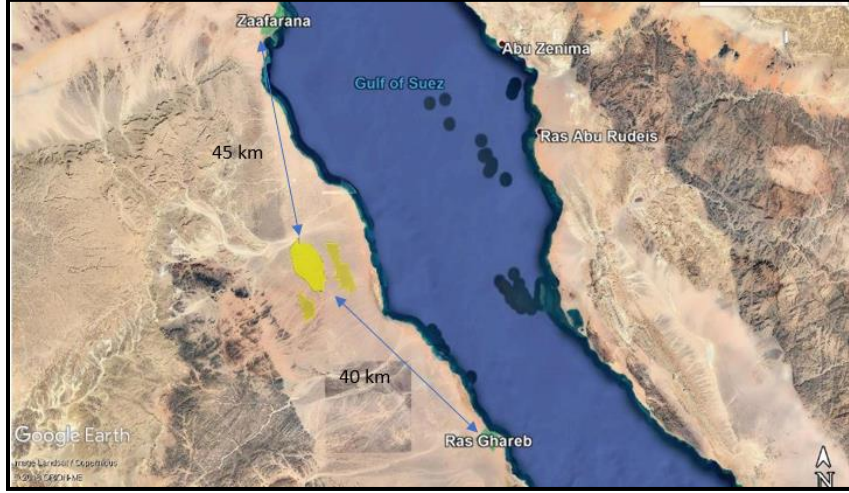
الشكل: 1 موقع المشروع والقرى الأقرب إليه