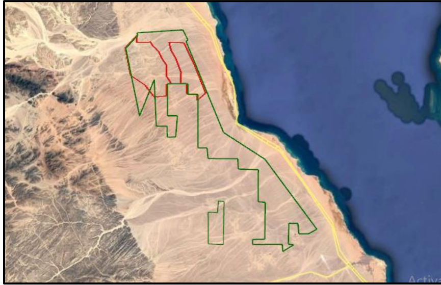
الشكل: 2 موقع المشروع (الأحمر) جزء من مساحة 284 كم 2 المخصصة لتطوير مشروعات مزارع الرياح